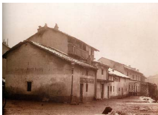
Gabinio M. Dalla serie "Torino che scompare" CORSO DANTE - ANGOLO VIA MAROCCHETTI (Gen/Feb 1900)

Nell'ambito dell'Unione Escursionisti Gabinio viene presentato all'architetto torinese Riccardo Brayda, anch'egli socio dell'ALA, attento conoscitore del prezioso passato architettonico torinese e piemontese. Gabinio lo segue nel corso degli scavi condotti nell'area dell'antica cisterna della Cittadella militare di Torino, che immortala nel 1897 in alcuni scatti oggi ritenuti di fondamentale importanza archeologica [6]. Stimolato dall'influenza di Brayda, Gabinio inizia a percorrere con la macchina fotografica le aree in corso di demolizione e ricostruzione in Torino; il lavoro sfocerà nella raccolta di 84 fotografie nota col nome di "Torino che scompare" che gli vale il Premio del Municipio all'esposizione promossa dalla Società Fotografica Subalpina [3] [4] [5].