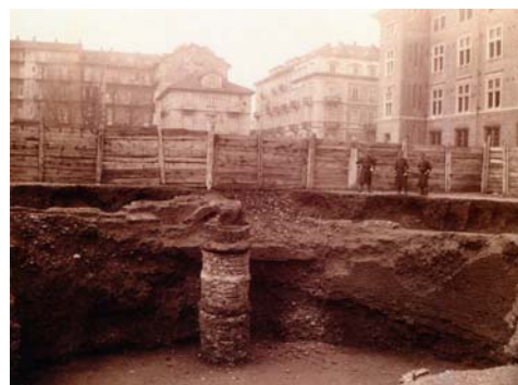
CISTERNONE DELLA ANTICA CITTADELLA (1896-1897)