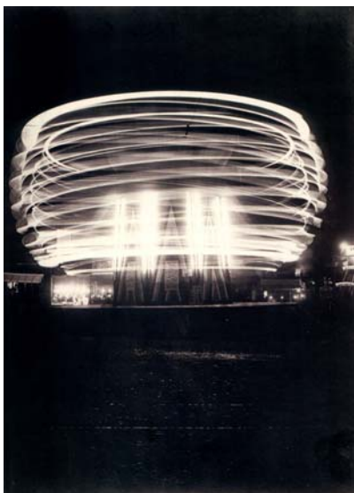
Gabinio M. UN GIRO DI GIOSTRA ZEPPELIN (12 Febbraio 1934)

della sede della Reale Mutua Assicurazioni e della ricostruzione di Via Roma, con riprese eseguite anche dalla sommità della nascente Torre Littoria. La serie di fotografie “Un giro di giostra Zeppelin” rappresenta la massima espressione della sua ricerca condotta attorno ai temi della luce e del movimento [4] [5].