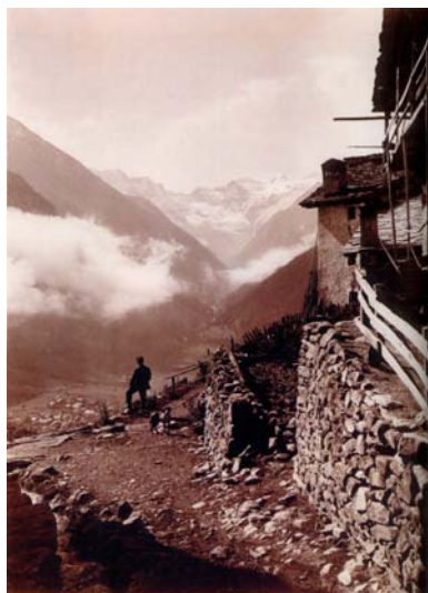
Gabinio M. [VALLE DI COGNE, PANORAMA DA GIMILLIAN CON COGNE E LA VALNONTEY] (Agosto 1931)

Il corpus fotografico di Mario Gabinio è costituito in gran parte da lastre di formato 18x24 centimetri e relative stampe, con un uso occasionale di mezzi formati e formati minori. L'uso di pellicola in rullo può dirsi sporadico. La sua attività in veste di fotografo è sommariamente ripartita in tre grandi periodi ed aree tematiche, che in parte si sovrappongono o si intersecano: